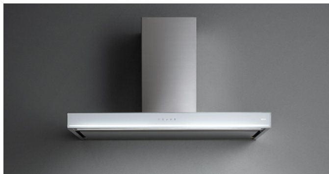
Фотография исключительно для информации Может не соответствовать выбранной версии.