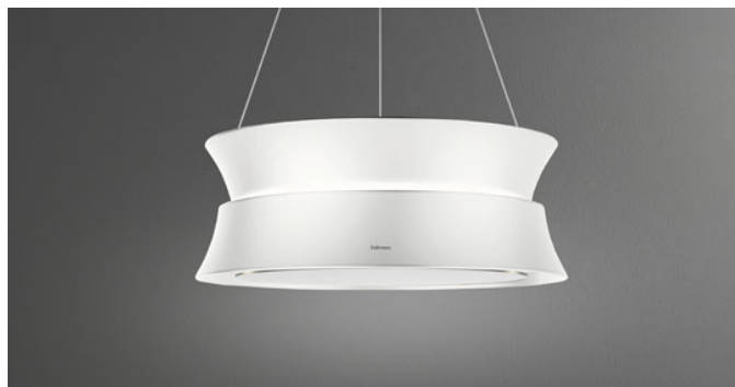
Фотография исключительно для информации Может не соответствовать выбранной версии.