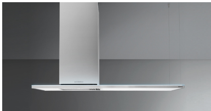
Фотография исключительно для информации Может не соответствовать выбранной версии.